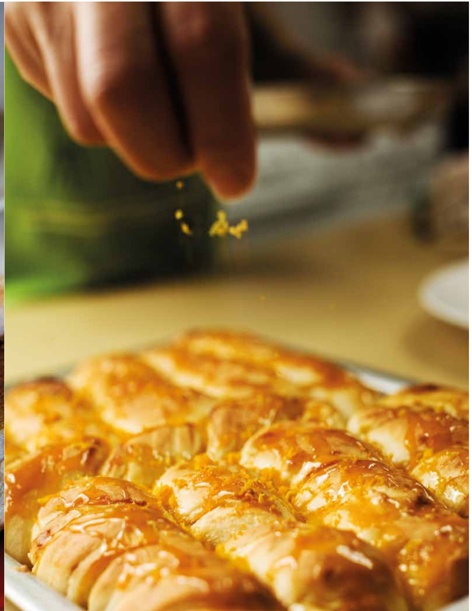
Sinaasappelbroodjes: Het water loopt je in de mond bij de geur van de verse broodjes en de geraspte sinaasappelschil waarmee ze worden bestrooid.