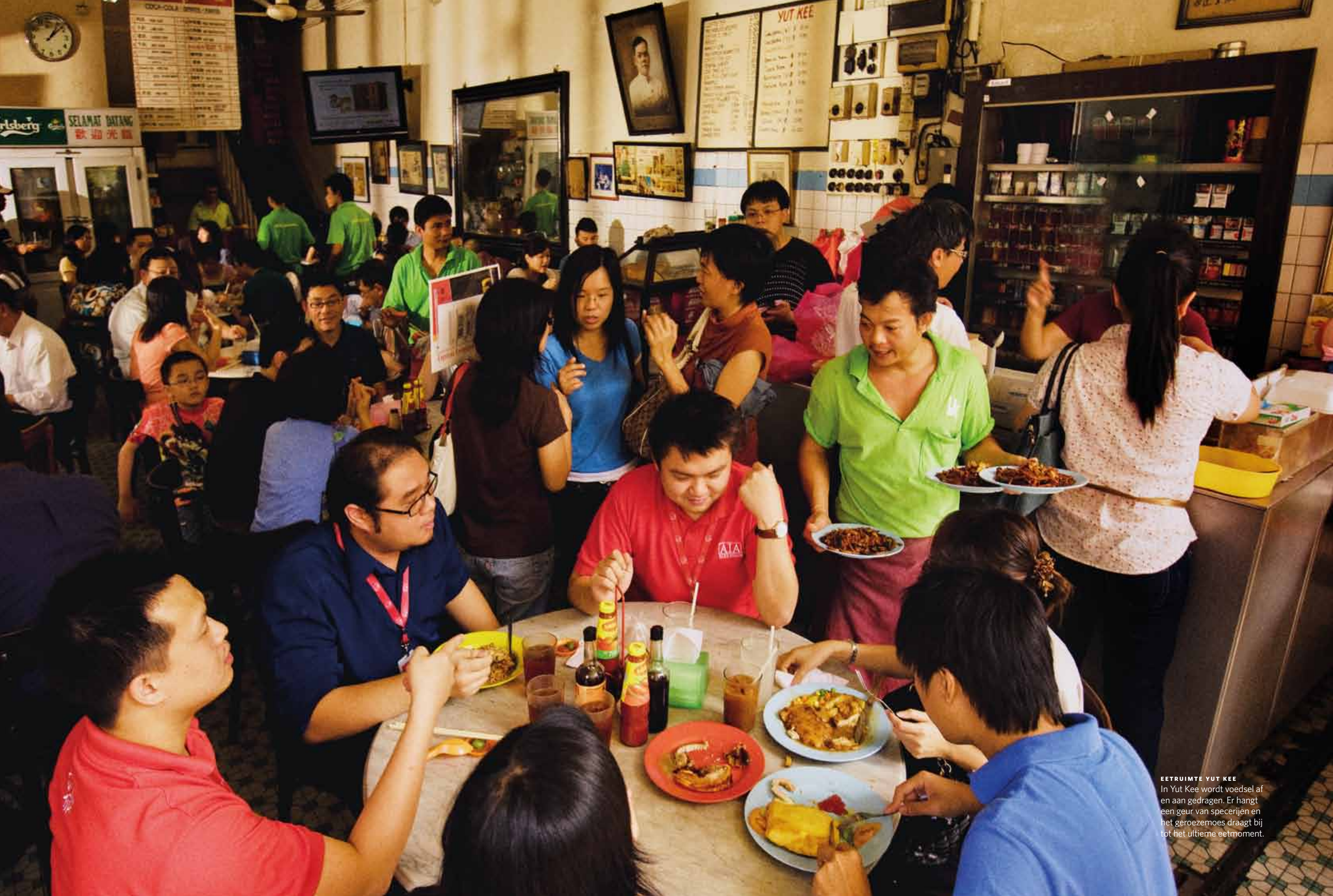
EETRUIMTE YUT KEE In Yut Kee wordt voedsel af en aan gedragen. Er hangt een geur van specerijen en het geroezemoes draagt bij tot het ultieme eetmoment.