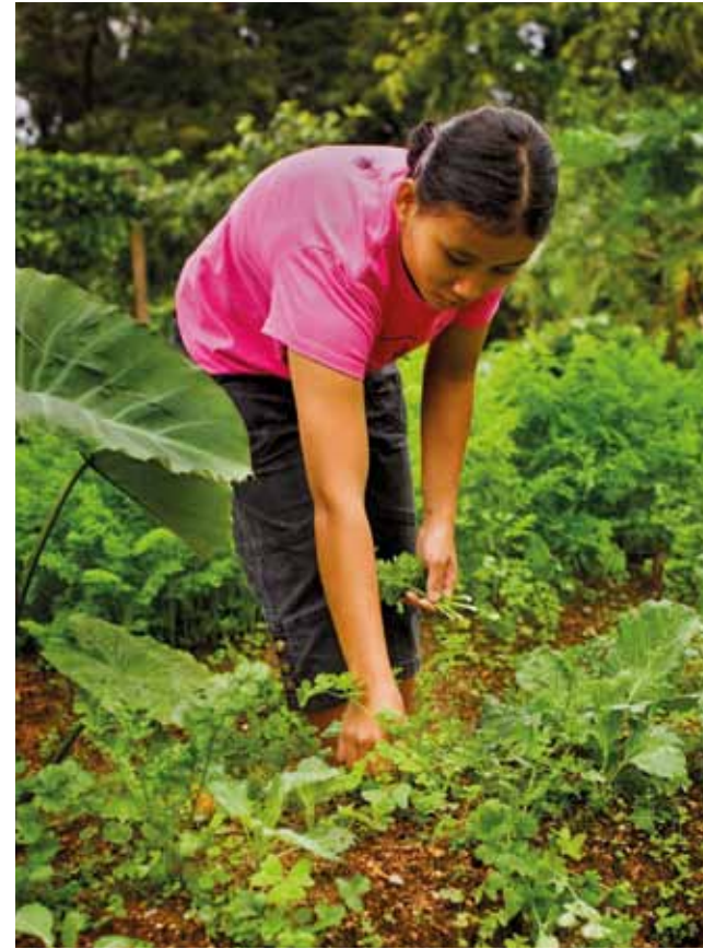
Op Fraser's Hill worden de kruiden zorgvuldig met de hand geplukt en de verse ingrediënten klaargezet voor het bereiden van de gerechten.