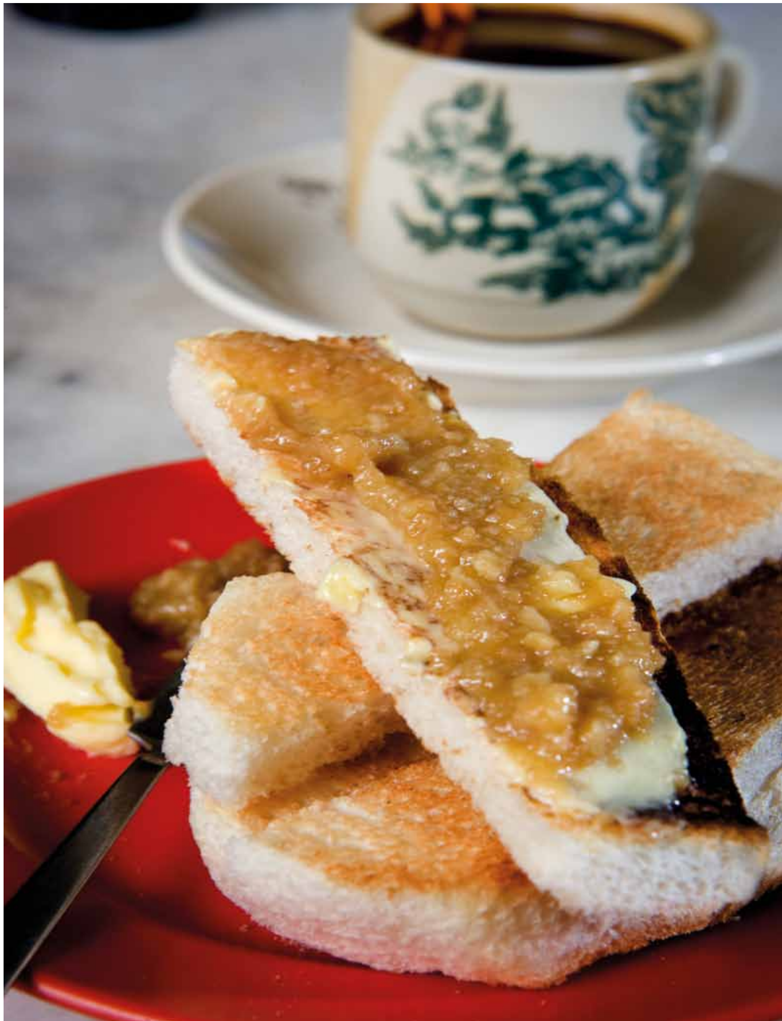
Boter kaya toast: Op Arundel wordt de middagthee geserveerd. Toast, boter en marmelade mogen daarbij niet ontbreken.