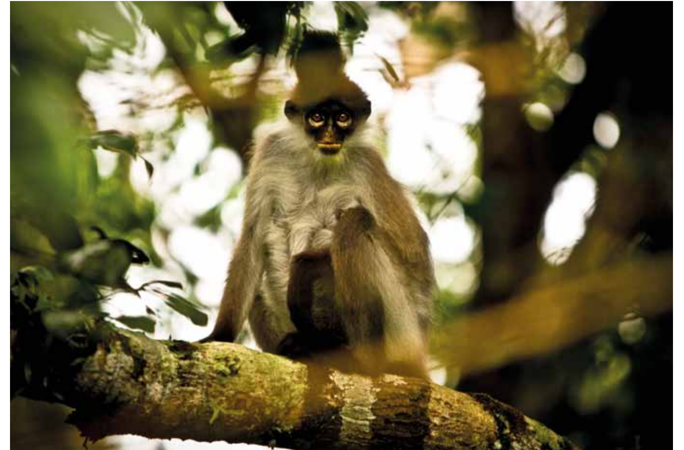
Boven: De Duistere aap van het Blad, "Spectacled Langur" bij Fraser's Hill Onder: Een foto van de oorspronkelijke kok bij de Arundel bungalow.