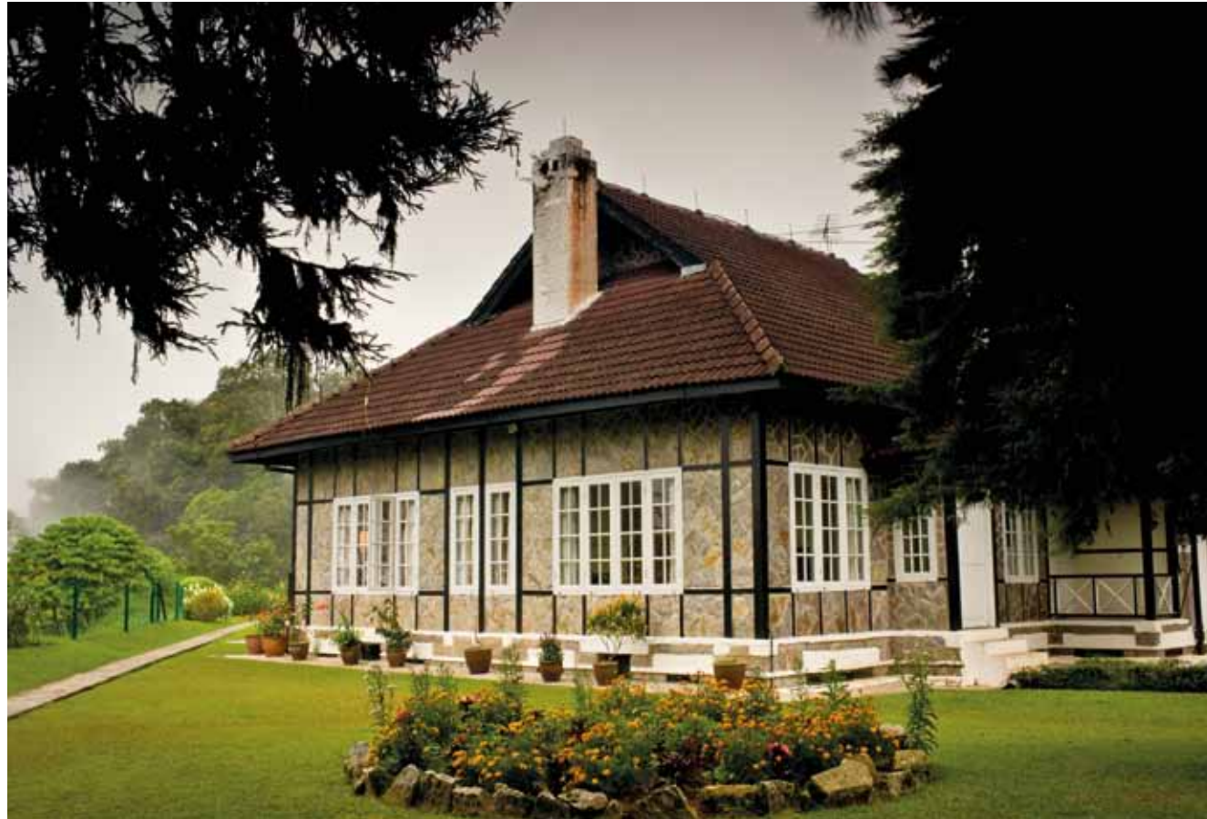
Boven: de "Arundel" bungalow bij Fraser's Hill Onderin: "The Smokehouse" restaurant en gastenhuis bij Fraser's Hill.